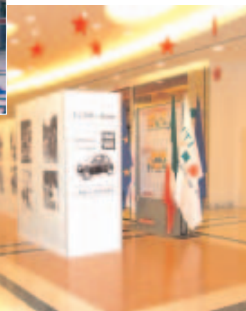
La Mostra allestita al Centro Commerciale RomaEst

incastonata in una grandissima e funzionale, oltre che bella, struttura polivalente commerciale (negozi di tutti i generi, supermercati, ristoranti e un cinema multisale) frequentata giornalmente da migliaia di visitatori. In seguito sarà possibile visitare la mostra nella cittadina di Zagarolo durante tutto il periodo delle festività natalizie. Cambio di location per il terzo appuntamento che dopo le vacanze di Natale si trasferirà al Centro Sarca di Milano. A questi appuntamenti ne seguiranno altri che, nei prossimi mesi, si rincorreranno per le vie e le città di tutt'Italia.